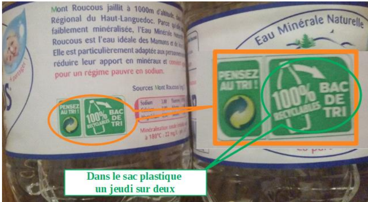
Dans le sac plastique un jeudi sur deux